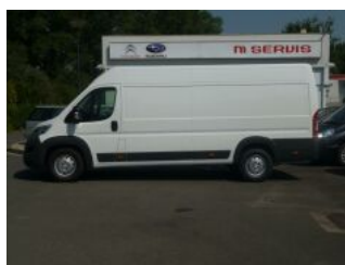
Foto ilustrativní. Údaje, ceny a vyobrazení obsažené v této kartě vozu mají informativní charakter. Toto obchodní sdělení není nabídkou ve smyslu § 1731 nebo § 1732 občanského zákoníku, ani se nejedná o veřejný příslib dle § 1733 občanského zákoníku. Výbava Furgon + rezervní kolo, zesílené odpružení, zadní dvoukřídlé dveře plechové otevíratelné do 270°